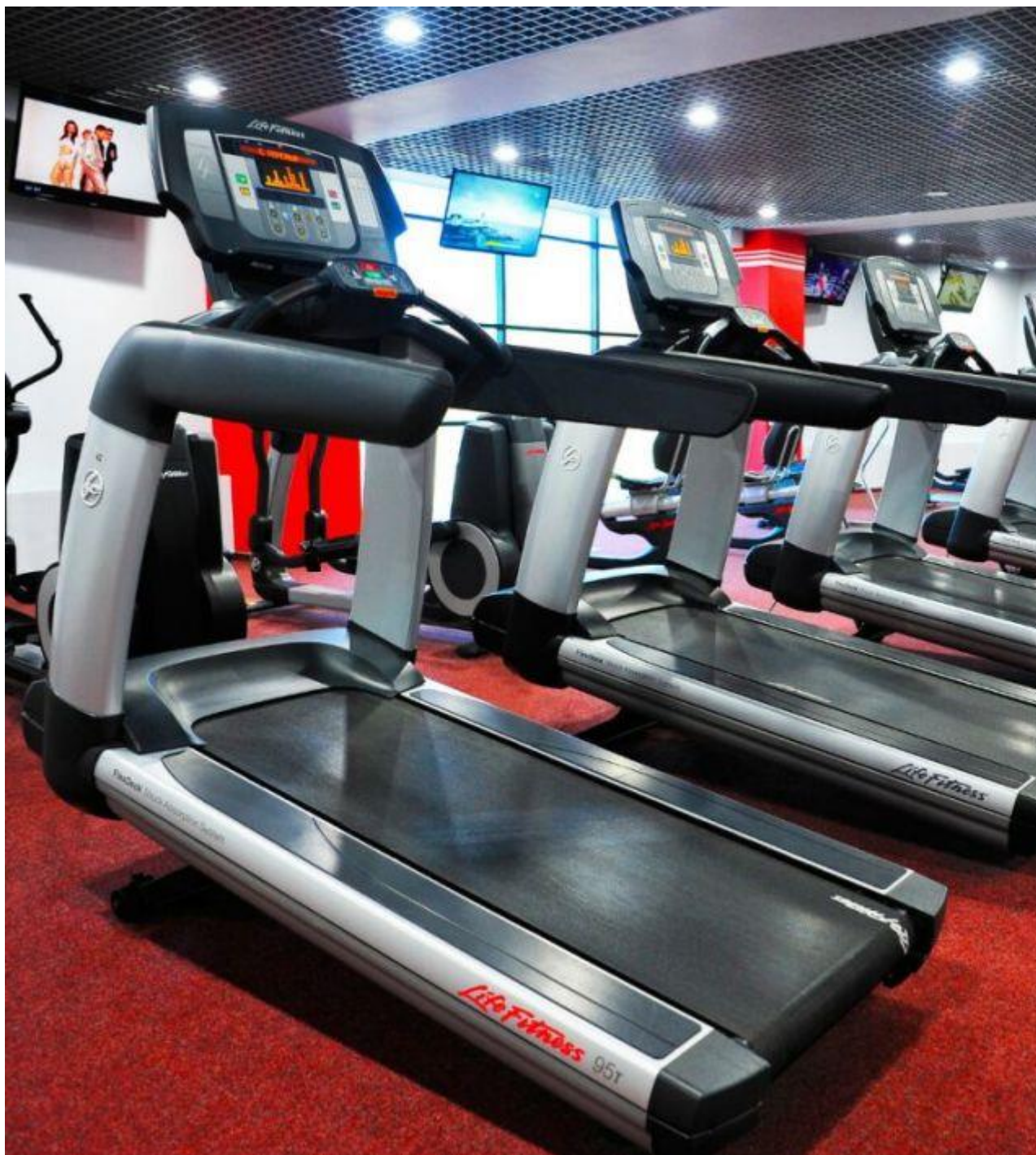
Рисунок 5 – Кардиотренажер