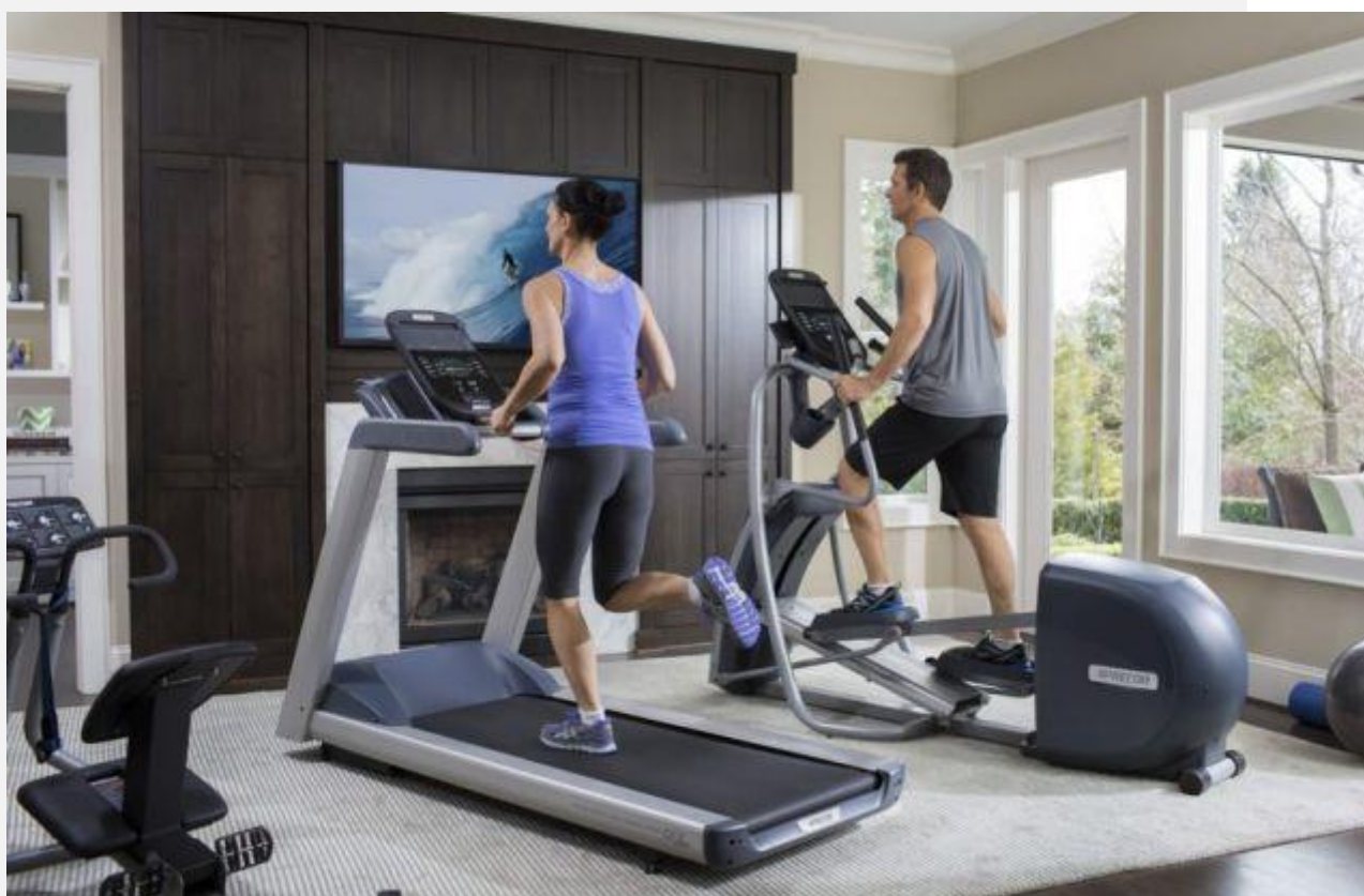
Рисунок 3 - Тренажеры - беговая дорожка и эллиптический тренажер.