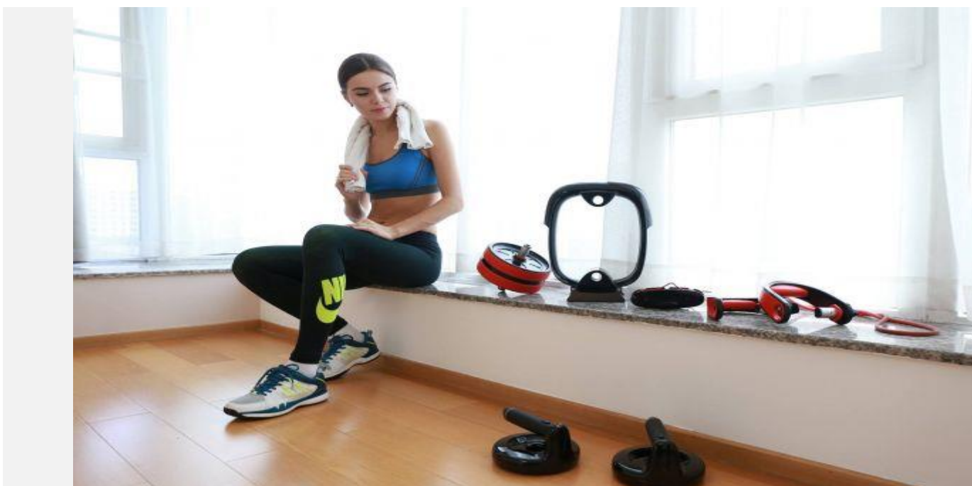
Рисунок 1 - Xiaomi MIJIA Smart Fitness от Move It - уникальный на сегодняшний день модульный тренажер. Это набор девайсов для функционального тренинга.