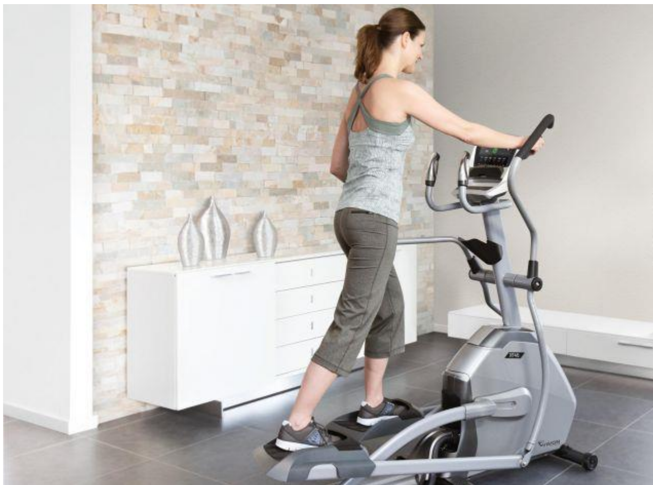
Рисунок 6 - Эллиптический фитнес-тренажер

Это – одна из уникальных конструкций, которая позволяет совмещать в себе несколько других тренажеров. Соответственно и эффект, который дает это приспособление, многогранен.