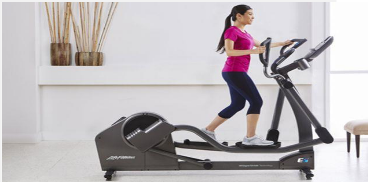
Рисунок 3 - эллиптический кросс-тренажер. Идеальный тренажер - стильный, компактный, эффективный, позволяет внести разнообразие в тренировочный процесс.