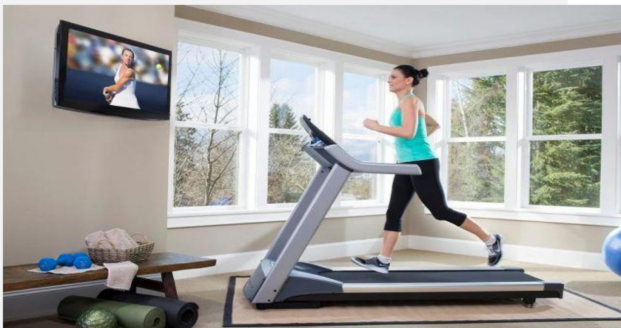
Рисунок 2 - Беговая дорожка - прекрасная возможность поддерживать себя в тонусе.

Рисунок 1 - Xiaomi MIJIA Smart Fitness от Move It - уникальный на сегодняшний день модульный тренажер. Это набор девайсов для функционального тренинга.