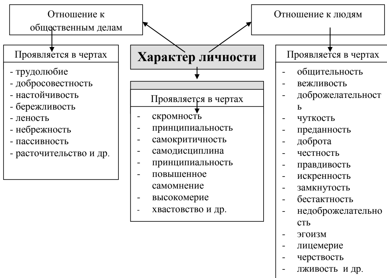
Рис. Характер личности, его основные черты и направления проявления

Отношение к самому себе проявляется в самооценке своих действий. Это одно из условий совершенствования личности, помогающих вырабатывать такие черты характера, как скромность, принципиальность, самокритичность, самодисциплину. Отрицательными чертами характера являются повышенное самомнение, высокомерие и хвастовство. Человек, обладающий этими чертами, обычно неуживчив в коллективе, невольно создает в нем предконфликтные и конфликтные ситуации. Нежелательна и другая крайность в характере человека: недооценка своих достоинств, робость в высказывании своих позиций, в отстаивании собственных взглядов. Скромность и самокритичность должны сочетаться с обостренным чувством собственного достоинства, основанном на сознании действительной значимости своей личности, на наличии известных успехов в труде на общую пользу. Принципиальность – одно из ценных личностных качеств, придающих характеру деятельную направленность.