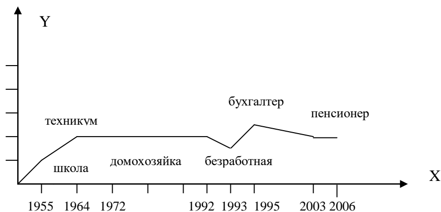
Рис. 1. Динамика статусного портрета члена моей семьи: ось OY – ранг статуса, ось OX – жизненный цикл индивида.

Задание 2. Изобразите статусный портрет члена вашей семьи и его динамику (пример)